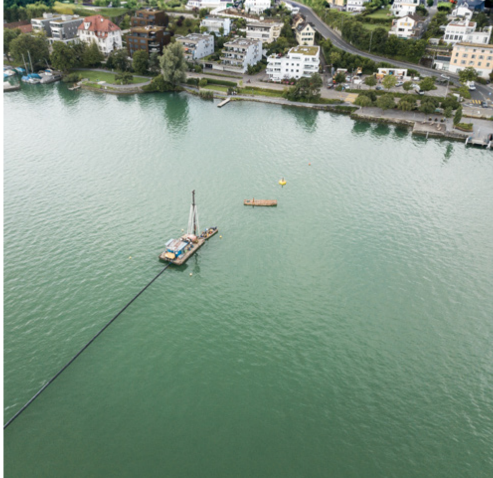
Le lac de Zurich, source de production d'énergie thermique en profondeur